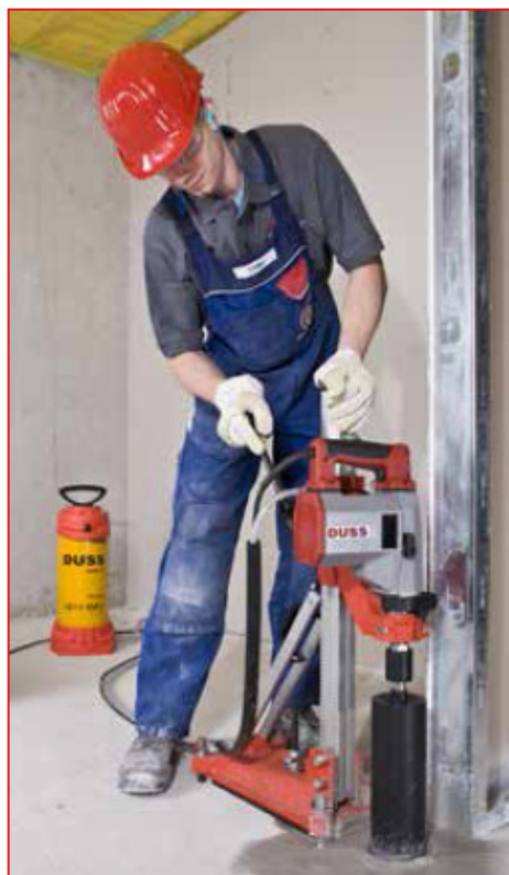
Forage dans le béton, à eau et avec support BS

Les artisans ont besoin de machines leur permettant de réagir en souplesse et très rapidement à différentes tâches et différentes conditions techniques sur le chantier. Avec notre système de carottage au diamant, nous proposons aux professionnels du bâtiment un système très élaboré. La diversité des carotteuses et une gamme d'accessoires ingénieux et complets permettent de répondre à tous les souhaits.