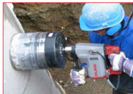
Forage de raccordement dans canalisation en béton, à eau et à main