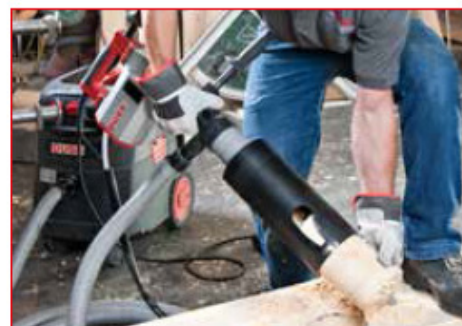
Forage dans le bois avec aspiration des poussières, à main