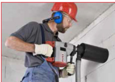
Forage dans la maçonnerie avec aspiration des poussières, à sec et à main