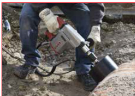
Forage dans canalisation en matières plastiques, à sec et à main