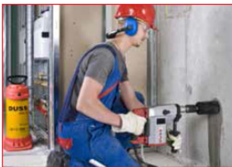
Noyage de boîtes dans le béton – à eau et à main