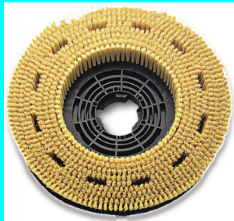
BROSSE FIBRE NATURELLE 40 60959 BROSSE FIBRE NATURELLE 50 60979

Pour le nettoyage délicat et le lustrage des cires.