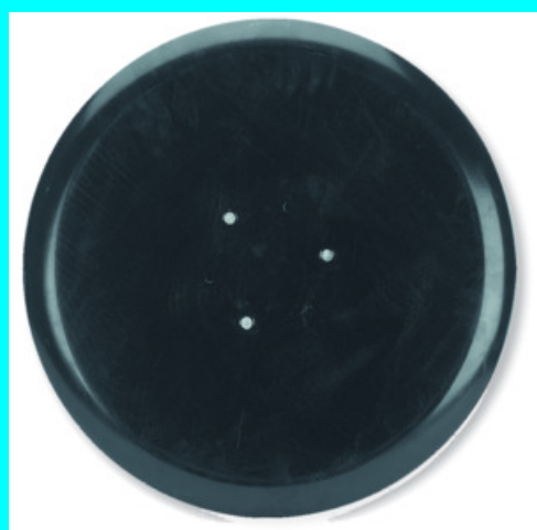
DISQUE METAL 60980

Pour les nettoyages des sols très délicats et application des cires.