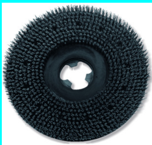
BROSSE CARBORUNDUM 40 61920 BROSSE CARBORUNDUM 50 61921

Pour le nettoyage délicat et le lustrage des cires.