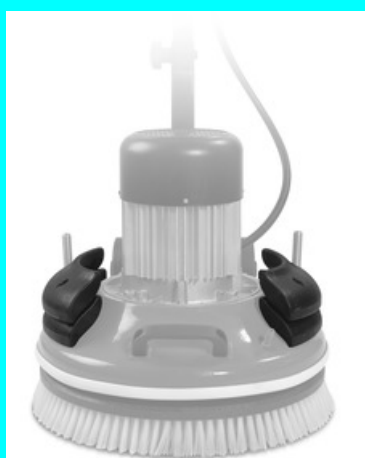
JEU DE POIDS A POLIR 61969

Pour le bourrage des joints. Spécialement indiqué pour les mortiers joints à base de ciment.