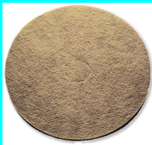
ABRASIF DOUX 40 60957 ABRASIF DOUX 50 60977

Pour sols normaux et nettoyage en profondeur.