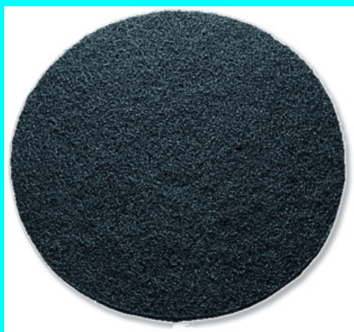
ABRASIF FORT 40 60956 ABRASIF FORT 50 60976

Pour sols résistants et nettoyage agressif.