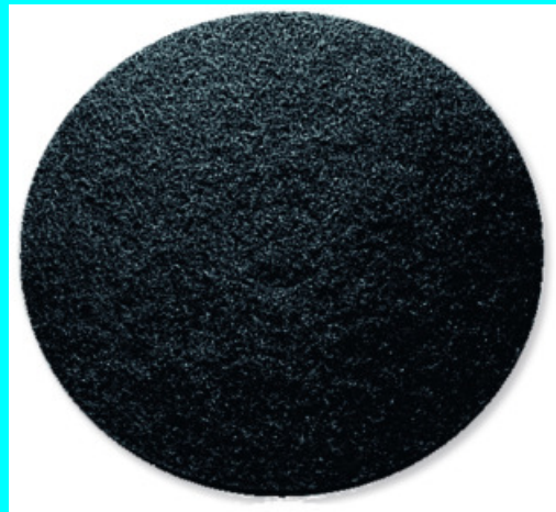
ABRASIF TRES FORT 40 60955 ABRASIF TRES FORT 50 60975

Base pour adapter les abrasifs, plaquettes diamantées et laine d'acier.