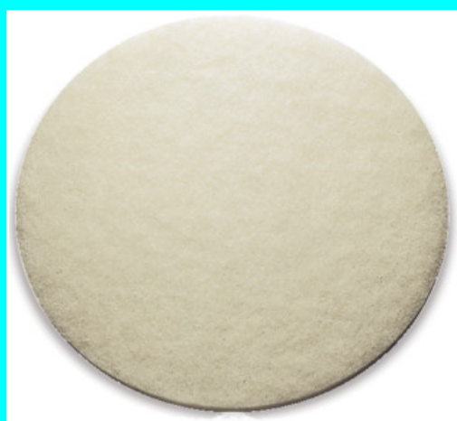
ABRASIF TRES DOUX 40 60958 ABRASIF TRES DOUX 50 60978

Pour sols délicats et nettoyages en profondeur.