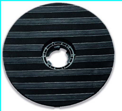
PLATEAU POUR ABRASIFS 40 60954 PLATEAU POUR ABRASIFS 50 60974

Base pour adapter les abrasifs, plaquettes diamantées et laine d'acier.